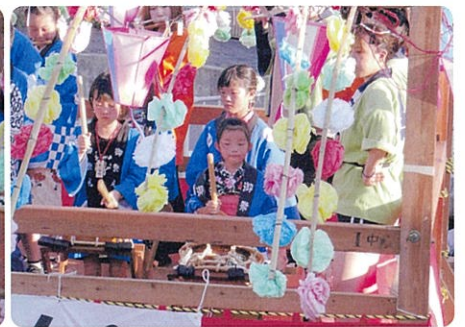
子供囃子の皆さんありがとう!