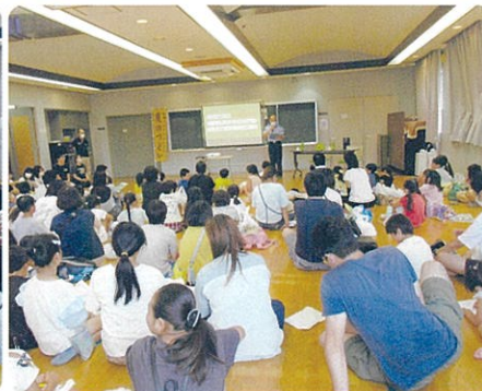
おまわりさんのお話よく聞いてね!