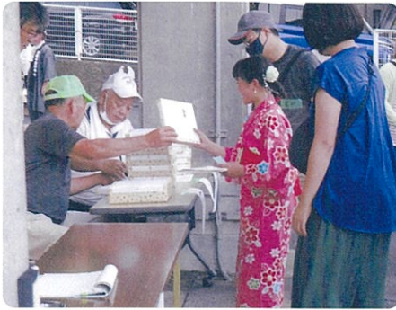
はい おめでとう!(抽選会)