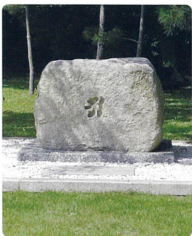
移設された四つ塚