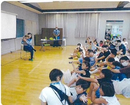
婦警さんとケンちゃんのお話面白いね!