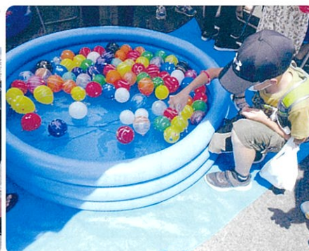
ヨーヨー 静かに上げてね!