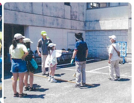
ストラックアウト 当たった!