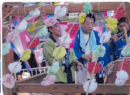
張り切っております!