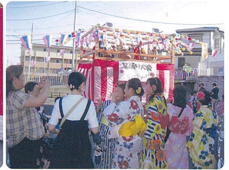
さあ 踊って下さいね!