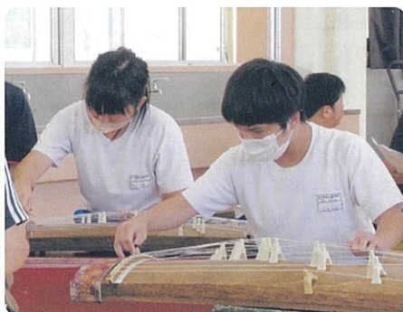
中学部 音楽事業・琴体験