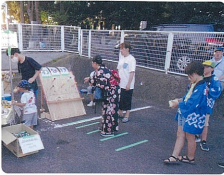
輪投げ 入った入った!