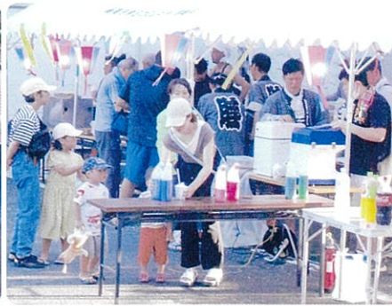
シロップ何にする?