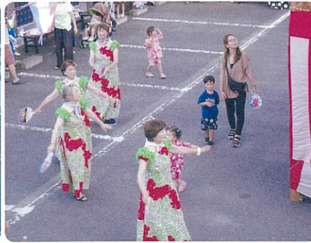
フラ・アロハの皆さんです!