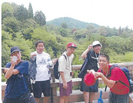
高等部 3年修学旅行・京都清水寺

これからの特別支援教育は「障害の有無に関わらず誰もがその能力を発揮し、共生社会の一員として共に認め合い、支え合い、誇りを持って生きられる社会の構築を目指す。」としています。本校においても、自分の能力を最大限に発揮させ、一人一人が輝く学校づくりに今後もしっかり取り組んでいきたいと思ひます。地域で育ち地域で自立していく子どもたちを、今後も応援してまいりますようお願いいたします。