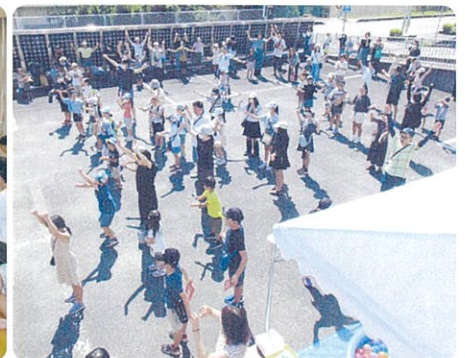
さあ 元気にラジオ体操!