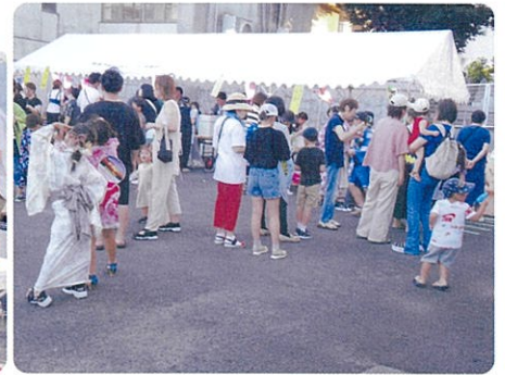
にぎわう模擬店前